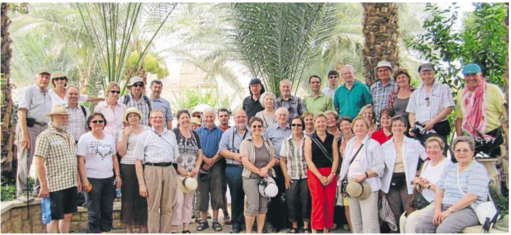
Die Reiseteilnehmer aus St. Jakob in einem israelischen Palmengarten